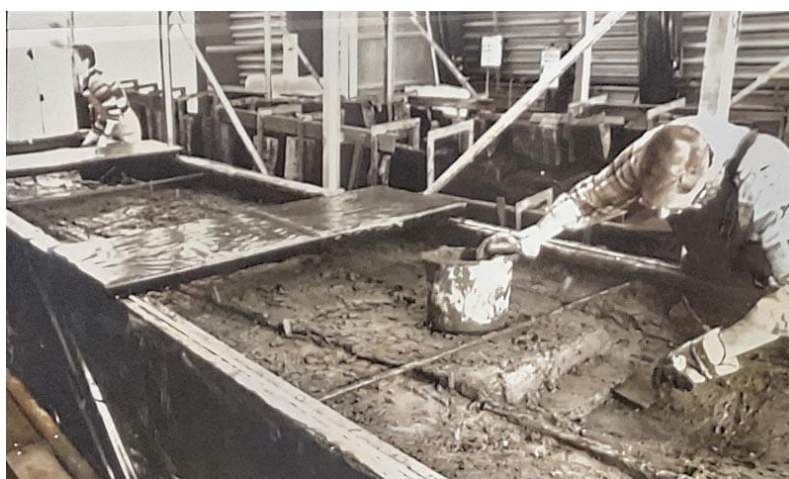
De in 2007 en 2008 gevonden boomstamkano's worden voorzichtig schoon gemaakt.