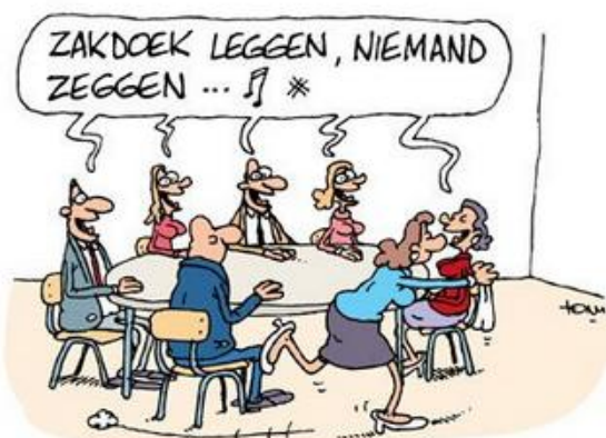
VOORDELEN VAN EEN RONDE VERGADERTAFEL

Het is weer hoog tijd voor een stukje ouderwetse gezelligheid. Wie heeft er een goed idee, waarmee we veel leden bij kunnen betrekken?