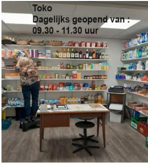
Toko Dagelijks geopend van : 09.30 - 11.30 uur