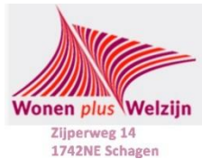
Wonen plus Welzijn Zijperweg 14 1742NE Schagen