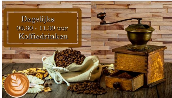
Dagelijks 09.30 - 11.30 uur Koffiedrinken