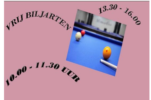
VRIJ BILJARTEN 10.00 - 11.30 UUR 13.30 - 16.00