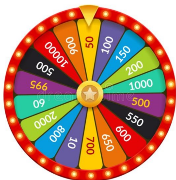
RAD VAN AVONTUUR

Aanvang: 14:00 uur Entree: € 4,00 (inclusief koffie/thee)